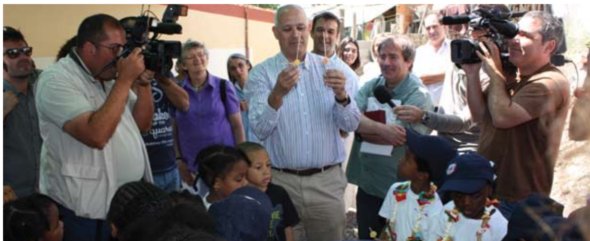
Sessão-debate realizado na Cova da Moura, Amadora.

I niciou-se em 2010, por iniciativa da ANPC, um conjunto de debates intitulado Olhares Sobre a Proteção Civil , cujo principal desafio foi o de permitir a reflexão e debate em torno das temáticas do ordenamento do território e da perceção dos riscos.