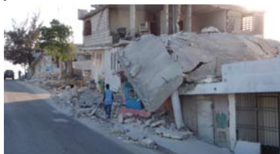
Destruição no Haiti