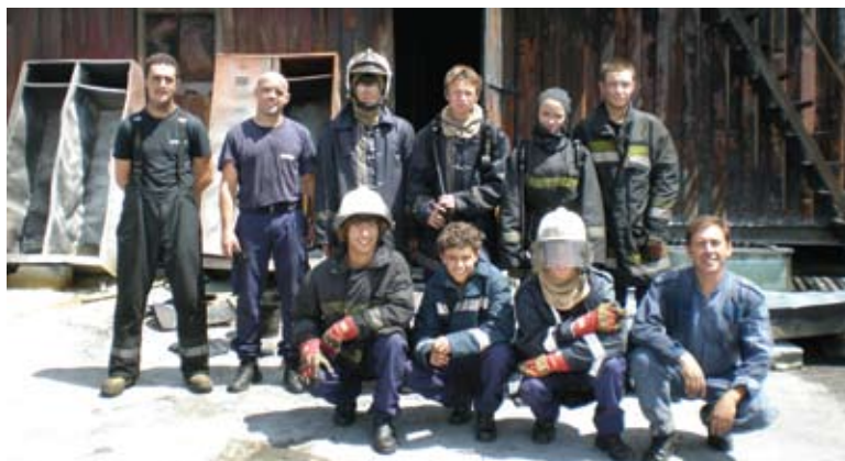
Alunos do curso de Bombeiros