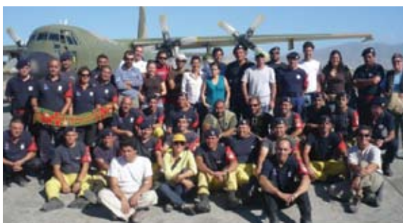
Força Operacional Conjunta (FOCON)