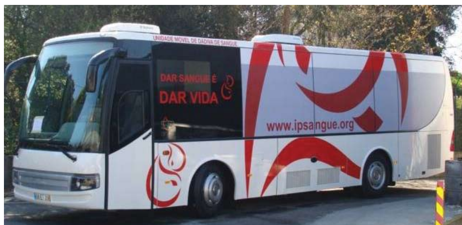
Unidade Móvel do Instituto Português do Sangue