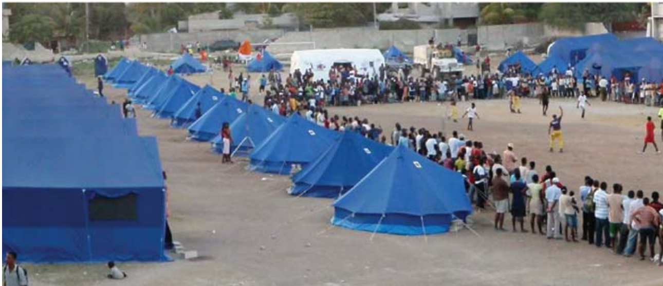
Campo Azul União Portugal - Haiti