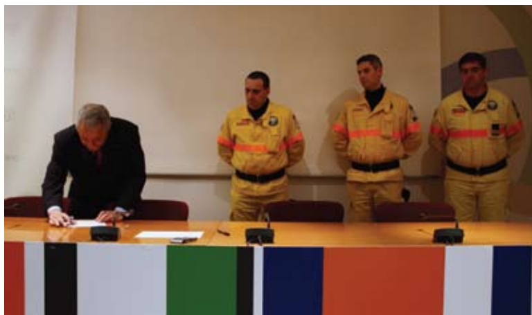
Nomeação dos Comandantes de Companhia da FEB