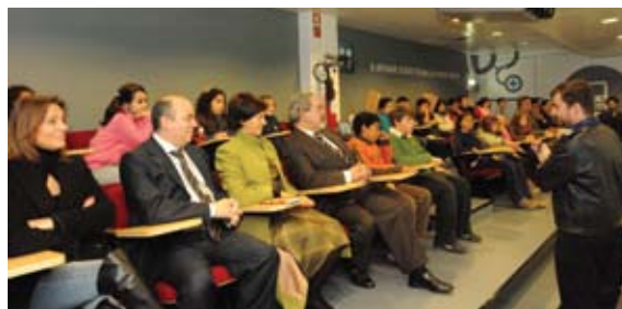
Apresentação do Projecto do SEF – Safernet