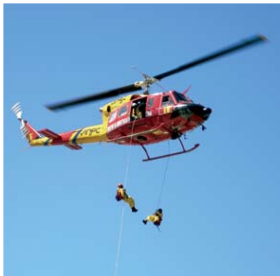
Força Especial de Bombeiros