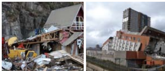
Destrução provocada pelo sismo no Chile, em 2010.

Perito certificado do Mecanismo Europeu de Proteção Civil