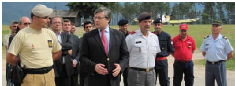
Visita ao CMA da Lousã 1.