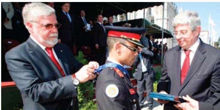
Condecoração dos Bombeiros