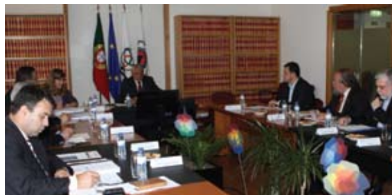
Reunião do Conselho Nacional de Bombeiros